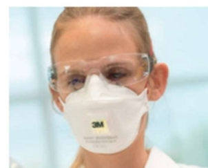
Półmaski filtrujące jednorazowego użytku

Luźno dopasowane nagłowia wchodzące w skład systemów z wymuszonym przepływem powietrza, w przypadku których oczyszczone powietrze jest dostarczane przez wąż oddechowy nie wymagają przeprowadzenia testu dopasowania. Ochrony takie mogą być wybierane z różnych powodów, w tym ze względu na konieczność zapewnienia wyższego poziomu ochrony, owłosienia na twarzy użytkownika, które może utrudniać szczelne dopasowanie dobrze przylegającej maski, długi okres użytkowania, komfort użytkownika oraz potrzebę stosowania jednego środka ochrony indywidualnej zapewniającego równocześnie ochronę przed innymi zagrożeniami.