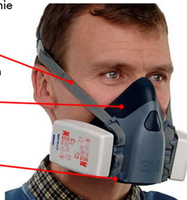
Rys. 4. Czynniki zmniejszające skuteczność ochron układu oddechowego

Wybierz odpowiedni rozmiar półmaski, aby dopasować ją do rozmiaru twarzy.