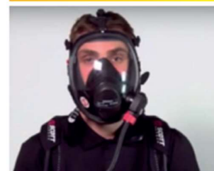
Szczelnie przylegające maski z wymuszonym obiegem powietrza lub połączone z aparatem powietrznym (w tym autonomiczny aparat powietrzny)