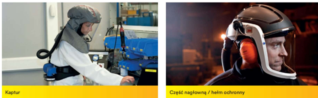
Rys. 8. Alternatywne rodzaje ochron układu oddechowego

Jeżeli użytkownik nie jest w stanie uzyskać odpowiedniego dopasowania przy użyciu pierwszej wybranej (pół)maski, należy podjąć próbę dopasowania przy użyciu alternatywnego modelu lub rozmiaru (pół)maski. Jeżeli nadal nie można uzyskać odpowiedniego dopasowania, należy wybrać inny rodzaj sprzętu ochrony układu oddechowego, który nie wymaga szczelnego przylegania do twarzy, np. luźno dopasowany kaptur lub nagłowie (rys. 8).