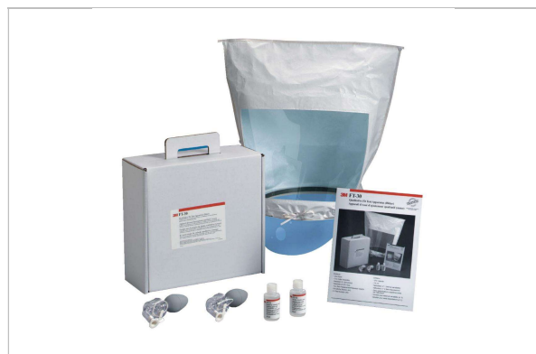
Rys. 5 – Zestaw do przeprowadzenia testu dopasowania 3M FT-30 Bitrex®

Jakościowe testy dopasowania to testy oparte na subiektywnej ocenie użytkownika dotyczącej przecieku przez obszar uszczelnienia twarzy poprzez wycucie aerozolu o gorzkim lub słodkim smaku (roztwór testowy sacharyny lub Bitrex) będącego czynnikiem testowym. Użytkownik (pół)maski stwierdza, czy jest w stanie wyczuć smak roztworu podczas wykonywania ćwiczeń w ramach testu dopasowania. Jeśli użytkownik nie wyczuje roztworu testowego w trakcie testu dopasowania, test uważa się za zaliczony (wskaźnik dopasowania 100). Dostępne są także inne metody, które są stosowane w innych krajach, jak np. rozpylanie octanu izoamylu (oleju bananowego) lub kwasu cynowego (opary drażniące).