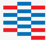
KONGRESU ZDROWIA PRACODAWCÓW RP